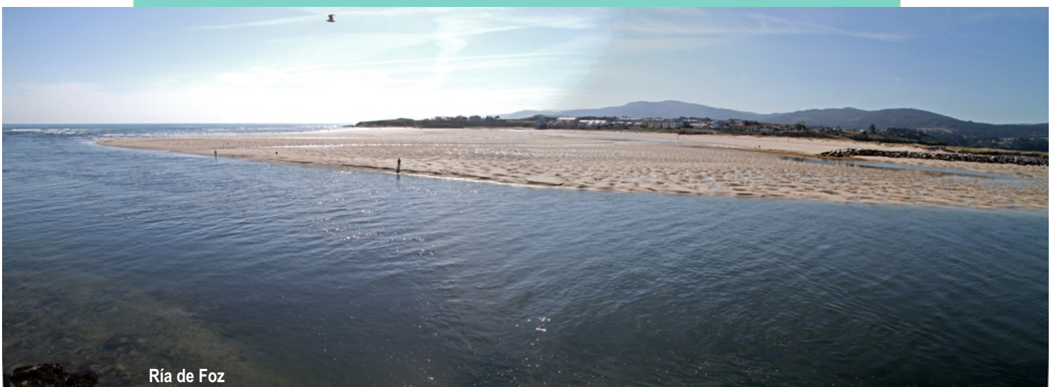
Ría de Foz