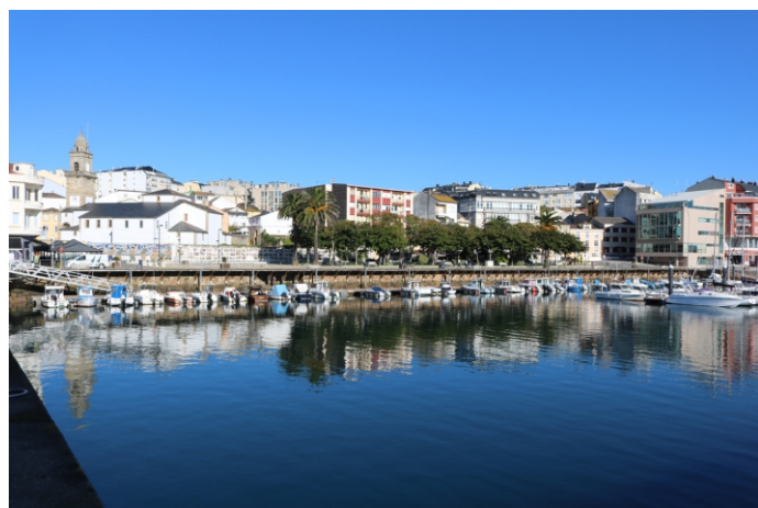
Foz e o porto