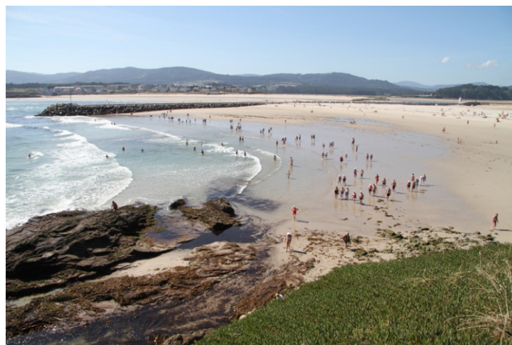
Praia da Rapadoira

Unha camiñada para percorrer a beira oeste da ría de Foz, e coñecer o espazo incluído na rede Natura como LIC/ZEC “Ría de Foz-Masma” e na ZEPA “Ría de Foz”, aproveitando unha grande parte do trazado da segunda etapa dos Camiños Naturais do Cantábrico e algún desvío que nos leve máis pola beira do mar. Os camiños naturais do Cantábrico son un roteiro litoral que en Galiza percorre, en sete etapas, 170 km, entre Ribadeo e Ladrido (Ortigueira).