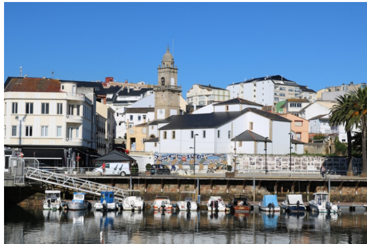
Foz desde o porto