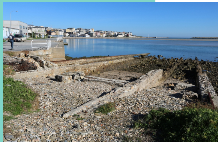
Restos das rampas dos antigos estaleiros