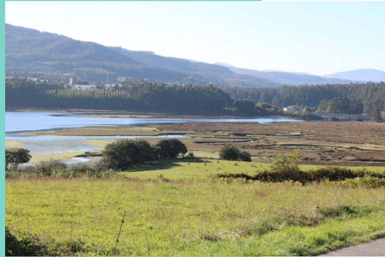
Esteiro do Masma