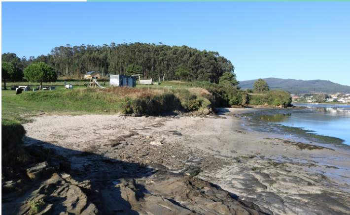
Praia dos Fondás