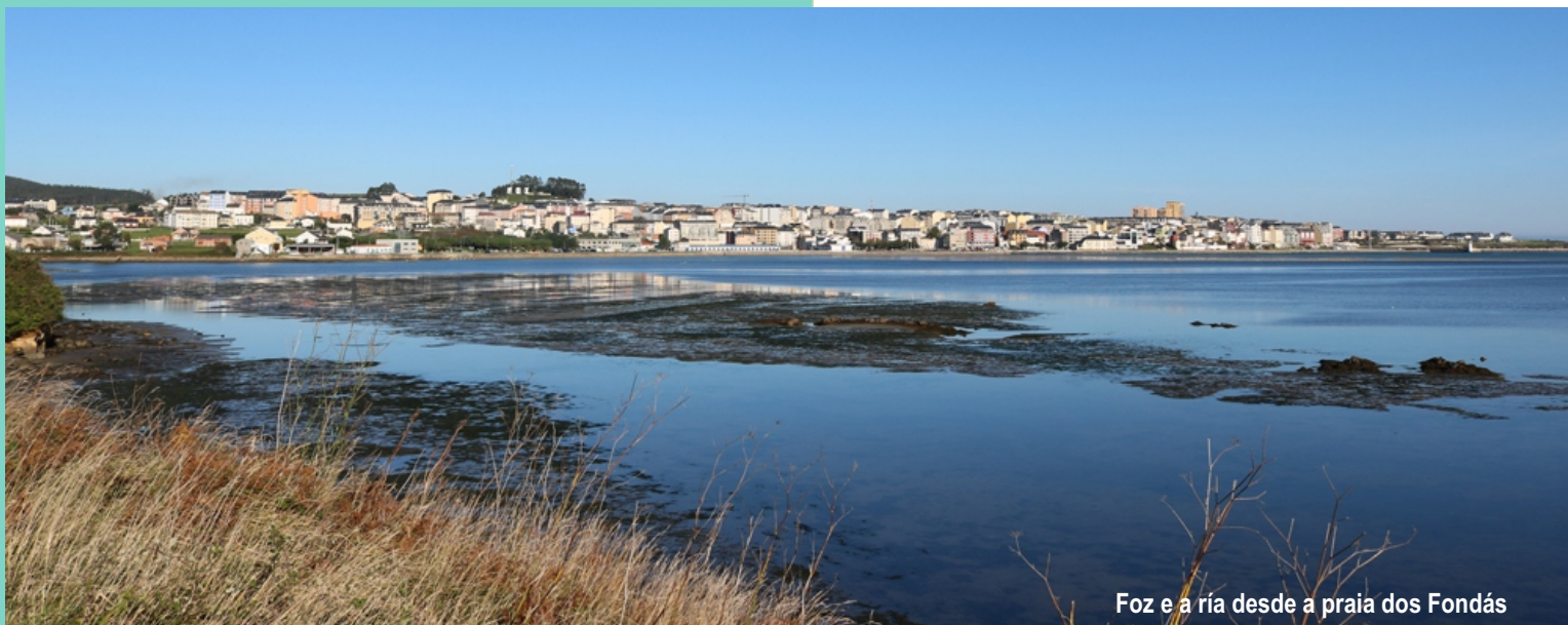
Foz e a ría desde a praia dos Fondás

Unha camiñada para percorrer a beira oeste da ría de Foz, e coñecer o espazo incluído na rede Natura como LIC/ZEC “Ría de Foz-Masma” e na ZEPA “Ría de Foz”, aproveitando unha grande parte do trazado da segunda etapa dos Camiños Naturais do Cantábrico e algún desvío que nos leve máis pola beira do mar. Os camiños naturais do Cantábrico son un roteiro litoral que en Galiza percorre, en sete etapas, 170 km, entre Ribadeo e Ladrido (Ortigueira).