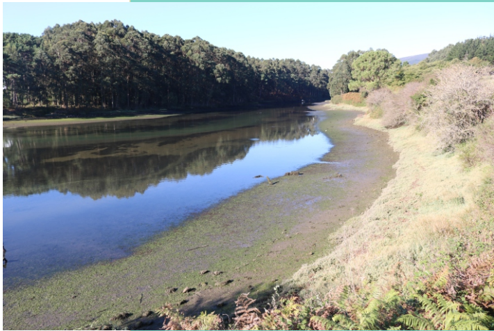
Desembocadura do río Centriño