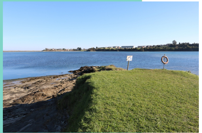
Punta dos Fondás