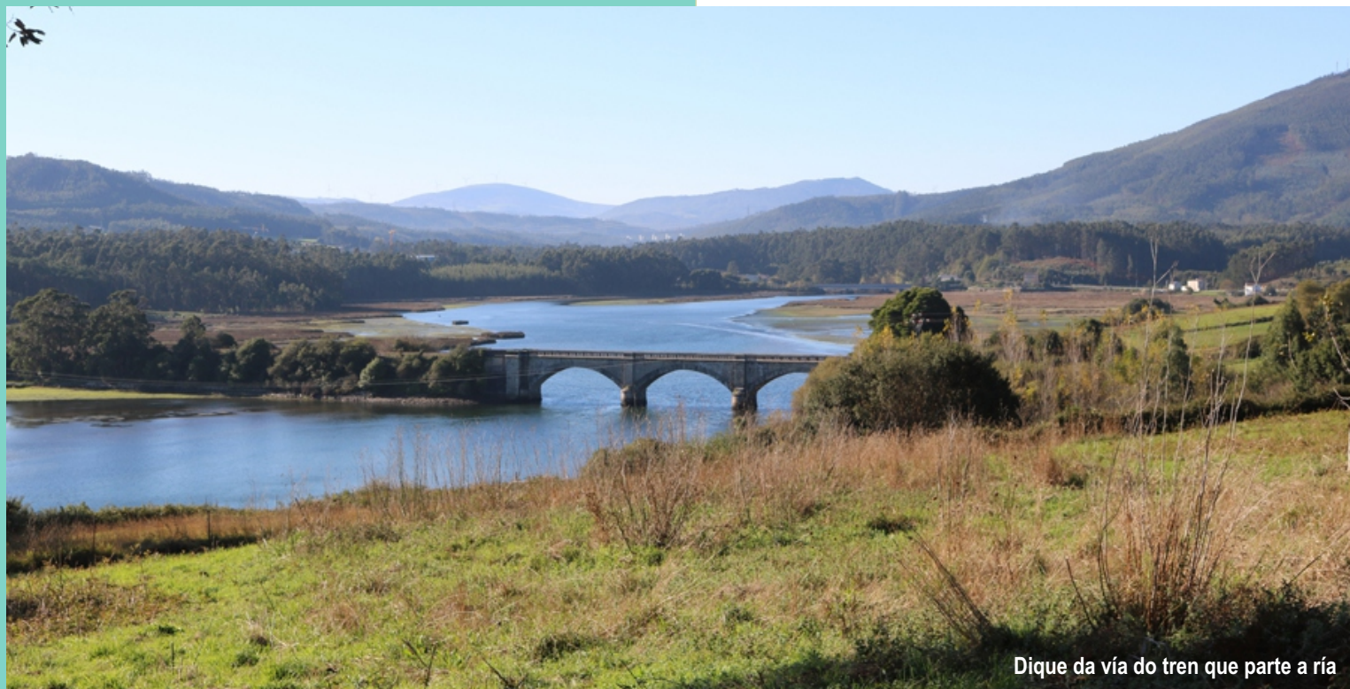
Dique da vía do tren que parte a ría