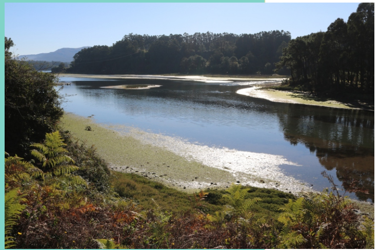
A Xunqueira. Esteiro do río Centiño